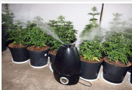
uprawa konopi, susz roślinny - marihuana

W ślad za materiałami sprawy do sądu trafił wniosek o zastosowanie wobec mężczyzny izolacyjnego środka zapobiegawczego w postaci tymczasowego aresztowania na trzy miesiące, do którego Sąd Rejonowy w Koszalinie się przychylił.