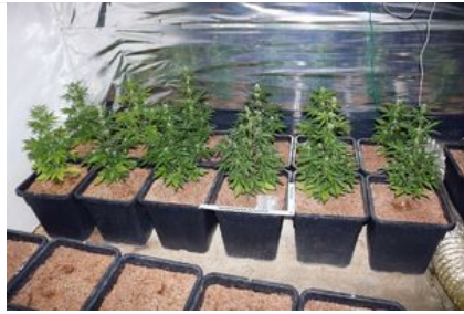
uprawa konopi, susz roślinny - marihuana