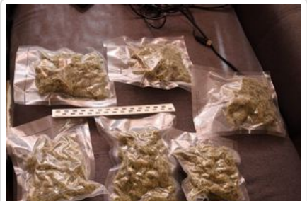
uprawa konopi, susz roślinny - marihuana