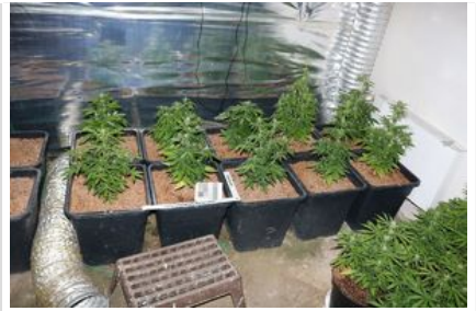
uprawa konopi, susz roślinny - marihuana