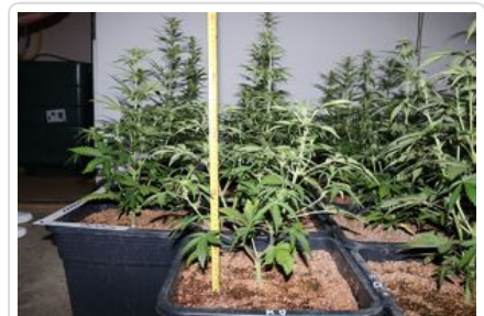
uprawa konopi, susz roślinny - marihuana