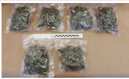
uprawa konopi, susz roślinny - marihuana