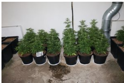
uprawa konopi, susz roślinny - marihuana