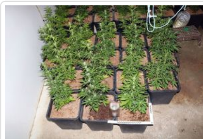
uprawa konopi, susz roślinny - marihuana