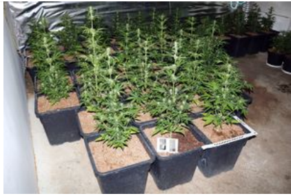
uprawa konopi, susz roślinny - marihuana